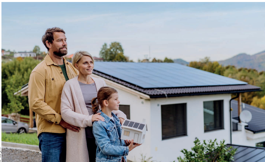
Cuidar da Casa Comum não é opcional para os discípulos de Jesus Cristo: é central para a nossa fé

O documento expressa com profunda preocupação que a UE esteja a desfazer a sua própria legislação e virando as costas para seu papel como líder global em questões climáticas. Muitas vezes, a «simplificação» levou à desregulamentação, por exemplo, por meio da legislação